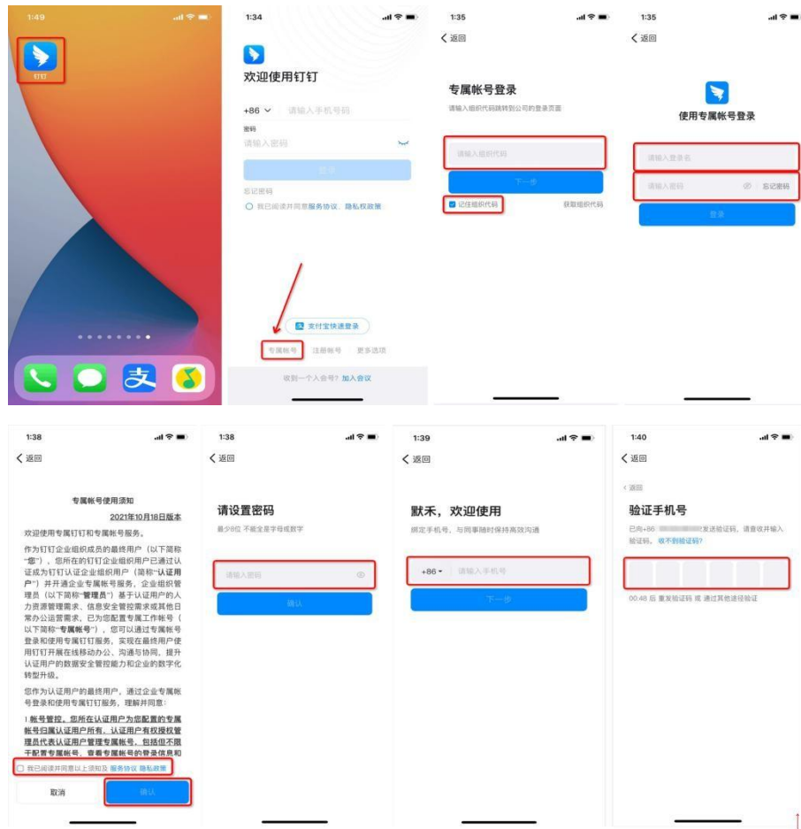
（图2：“钉钉”帐号登录流程）